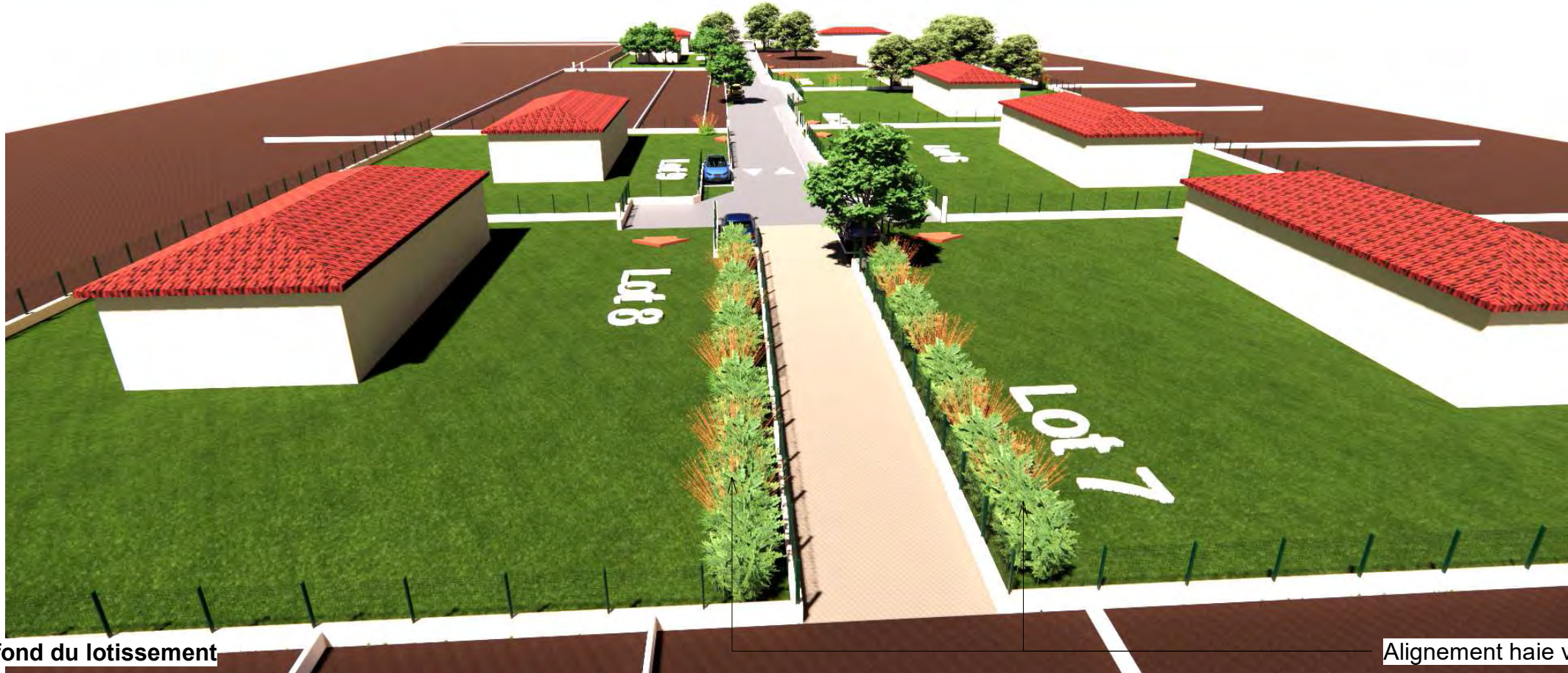
Vue depuis le fond du lotissement