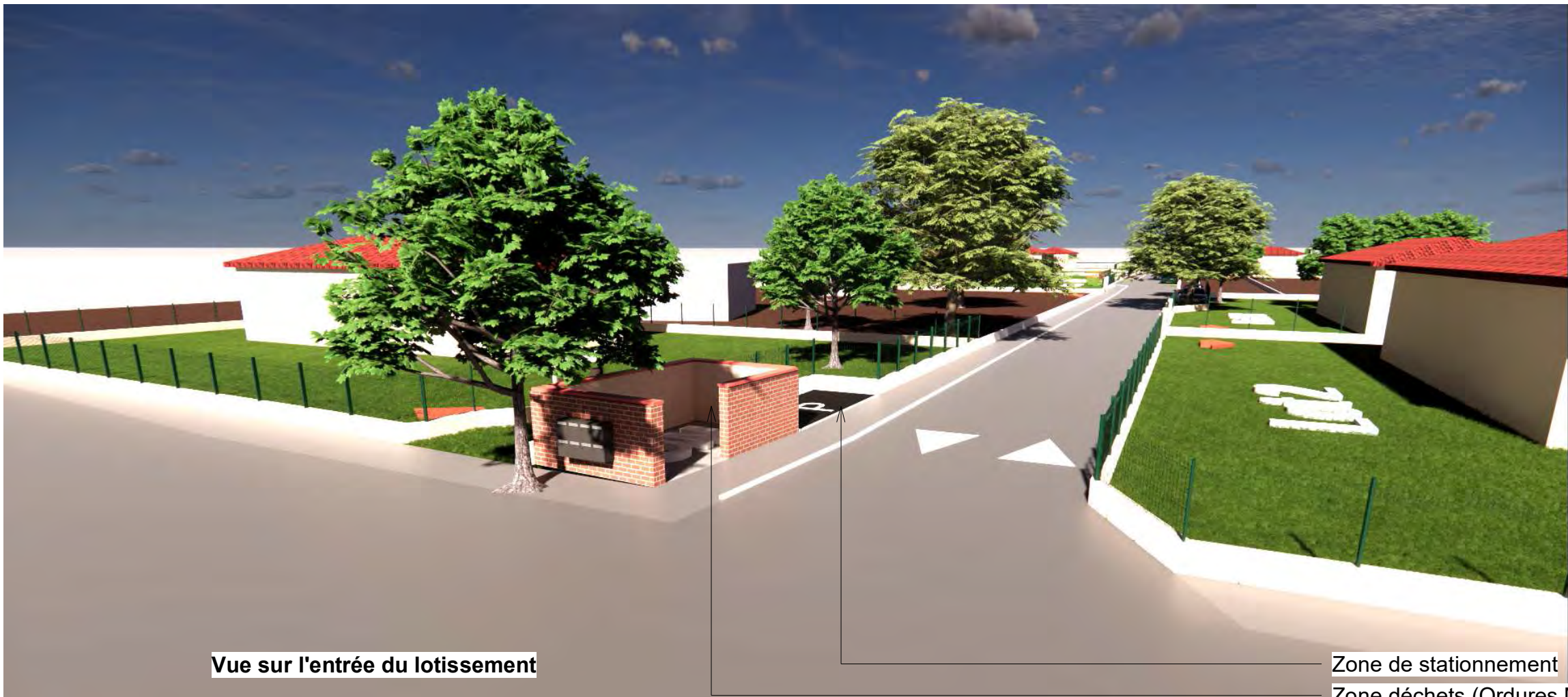
Vue sur l'entrée du lotissement