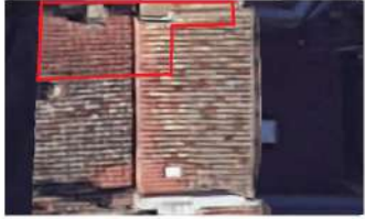
Localisation Echelle 1:175